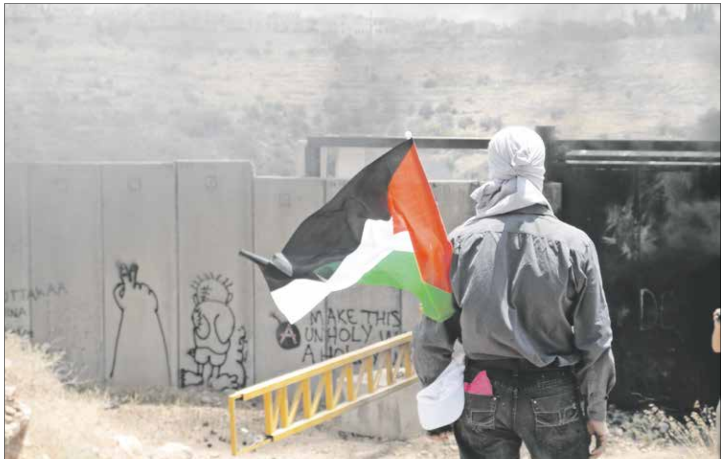
Tot 15 mei protesteren Palestijnen elke week aan de grens met Israël.

Ateek wil niet alle schuld voor de ellende van de Palestijnen bij de joodse zionisten leggen. Hij steekt ook een beschuldigende vinger uit naar het Westen en hun steun aan de implementatie van de Britse Balfour-verklaring van 1917, die de vestiging van "een nationale thuis" voor het joodse volk in Palestina in het vooruitzicht stelde. Zonder de Holocaust en de westerse schuldgevoelens errond zou het zionistische project nooit zo snel verwezenlijkt zijn, meent Ateek. Volgens de tachtigjarige geestelijke waren veel westerse zionistische christenen blij met de oprichting van de staat Israël, want de terugkeer van de joden naar Palestina was voor hen de vervulling van een profetie uit het Oude Testament. Het was een teken voor het naderende einde van de we-